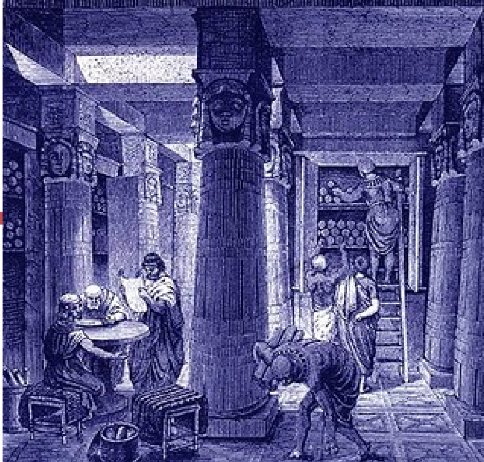
Grabado Biblioteca de Alejandría